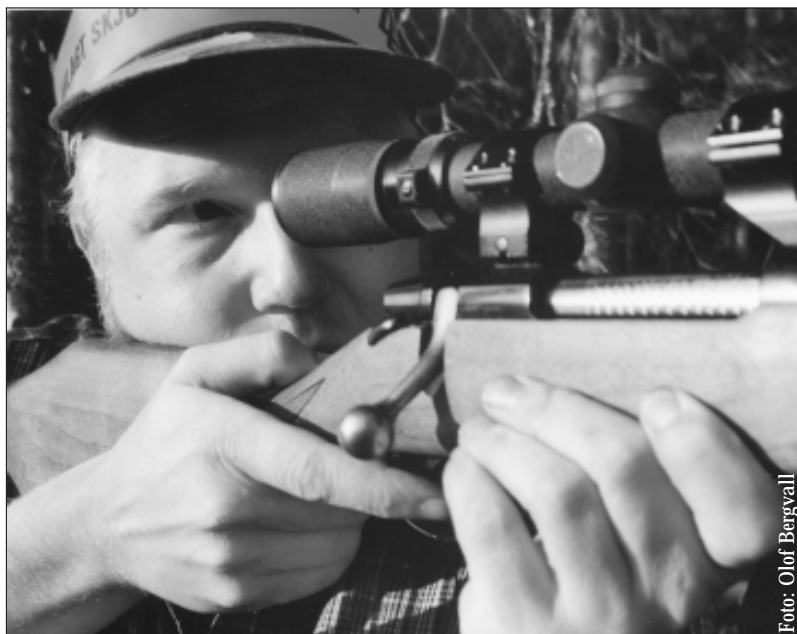
Tretton procent av svenskarna lever i ett hushåll med minst en jägare.

den. När vi gjorde en fördjupad analys av varför de tillfrågade är positivt inställda till jakt visade det sig vara fyra faktorer som påverkade inställningen till jakt, nämligen;