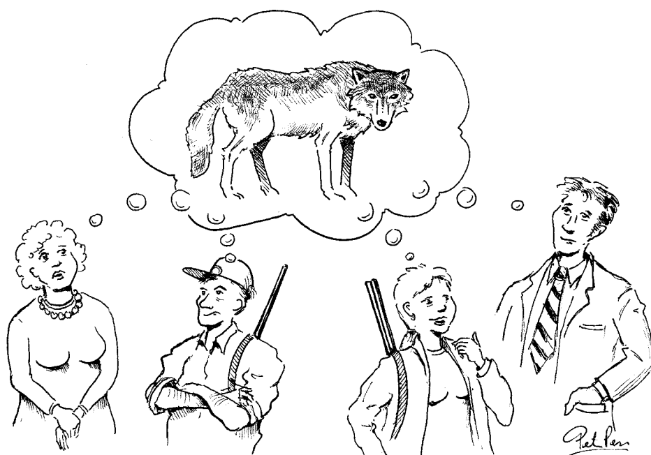
illustration: Peter Robertz