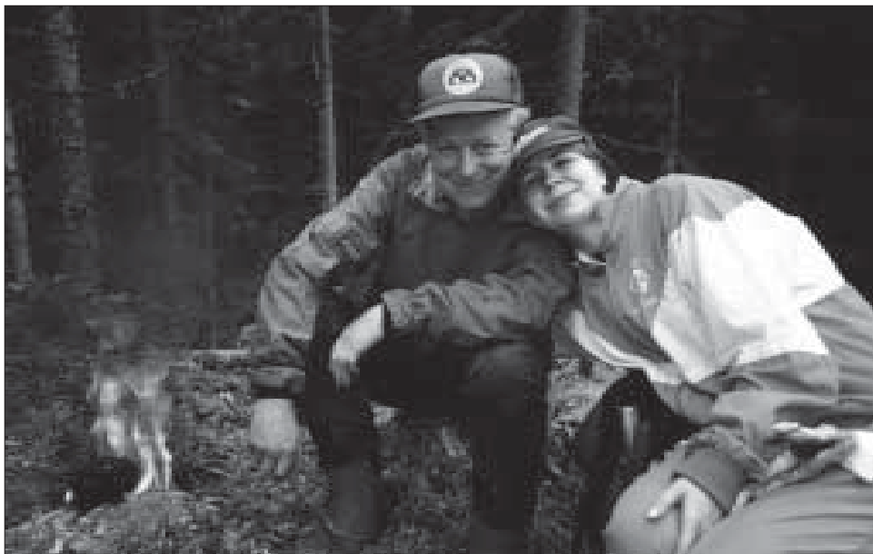
Två generationer skogsägare tar en kaffepaus mellan arbetsinsatserna på hygget.