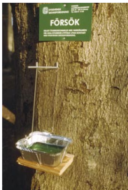
Figur 3. Fönsterfällorna som användes för skalbaggsfångst.

denna studie undersöktes vedlevande skalbaggar i bokskog, och hur deras förekomst påverkas av bokhögstubbars egenskaper, tillgången till andra bokhögstubbar i omgivningen, samt närheten till värdekärnor som har haft en kontinuerlig förekomst av död ved. Resultaten ligger till grund för rekommendationer för naturhänsyn i brukad bokskog.