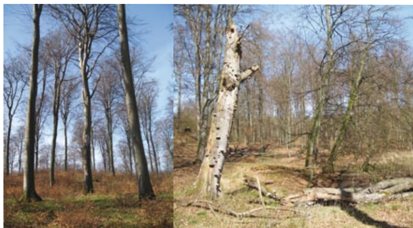
Figur 8. En kandidat till evighetsträd i Torup som lämnas kvar när resten av bokarna avverkas (t. v.). Högstubbe och hänsynsträd i beståndskant mot våtmark i Torup (t. h.).

Jörg Brunet är docent vid institutionen för sydsvensk skogsvetenskap, SLU, Box 49, 230 53 Alnarp E-post: Jorg.Brunet@ess.slu.se