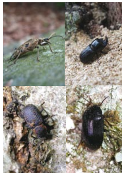
Figur 4. Exempel på skalbaggar som trivs i bokhögstubbars olika livsmiljöer (se Figur 7). Lövträdslöpare (o.v.) förekommer i nydöd ved medan larverna av noshornsoxe (o.h.) lever i mer rötad ved. Vanlig svampsvarthage (n.v.) utvecklas i fnöskticka. Kolsvart kamklobagge (n.h.) lever i mulm i trädhål.

På Söderåsen varierade antalet vedlevande arter per fälla mellan 14 arter vid en stubbe i ett mindre, isolerat, bokbestånd till 53 arter vid en grov högstubbe i värde-