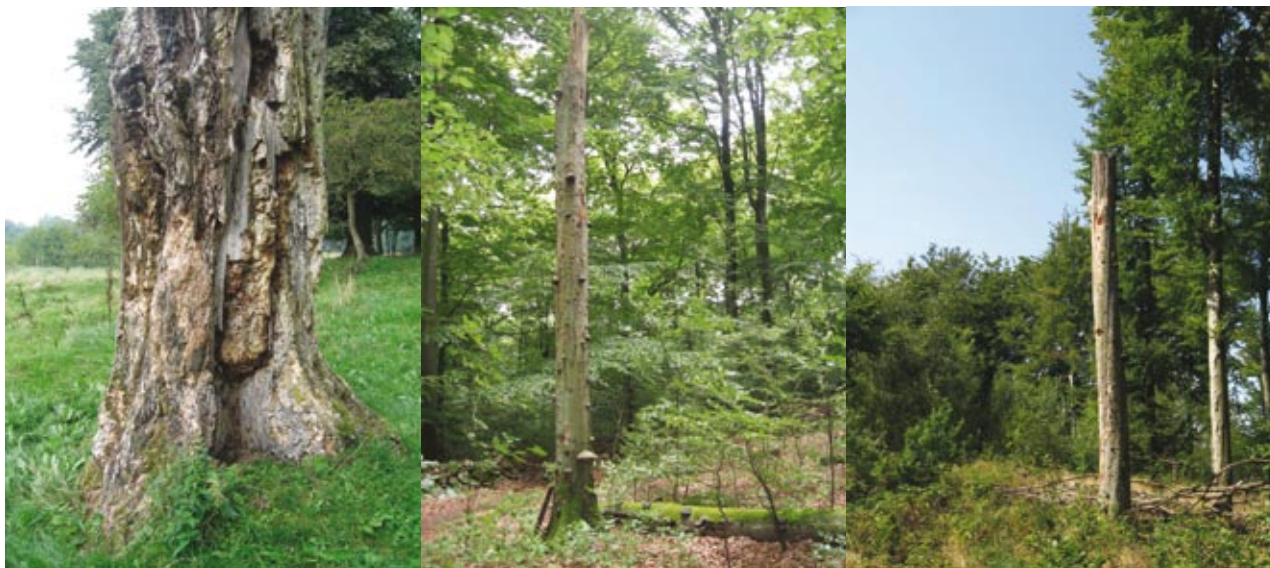
Figur 5. Torup: Gammal jättestubbe. En livsviktig miljö för mulmlevande arter. Söderåsen: Högstubbe i slutna skog som gynnar många svamplevande skalbaggsarter. Söderåsen: Solexponerad högstubbe som bl.a. gynnar vissa långhorningar, t.ex. den sällsynta bokblombocken.

emot ingen roll. Resultaten tyder på att de flesta arter rör sig relativt ohindrat inom sammanhängande bokskogar och letar upp lämpliga vedmiljöer.