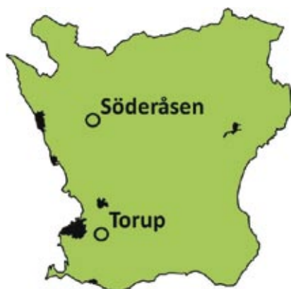
Figur 2. Undersökningsområdena i Skåne.

Skalbaggar är en grupp med särskilt många vedlevande arter och en stor del av dessa utnyttjar högstubbar. I äldre bokskogar bildas högstubbar ofta genom att träd som är angripna av fnöskticka bryts av. I