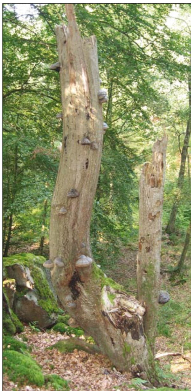
Figur 1. Bokhögstubbar i en liten brant i Klåveröd på Söderåsen i Skåne.