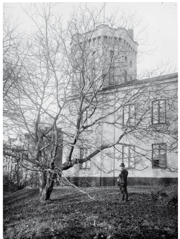
Skogsinstitutet i Stockholm, föregångare till Skogshögskolan, var 1800-talets skogliga tankesmedja. Liknande roll hade också det privata skogsinstitutet under dess korta verksamhetstid.

Med hänsyn till de stora åsiktsskillnaderna tillsatte regeringen en utredning 1965, Skogspolitiska utredningen, SPU. Förslaget från utredarna 1973 var att uthållighetsprincipen i 1948 års lag skulle överges. De ansåg att principen var för-