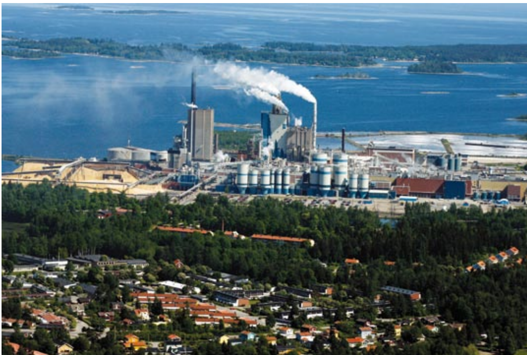
Skogsindustrins långsiktiga råvarubehov har haft stor betydelse för lagstiftningen om ett uthålligt skogsbruk. Korsnäs produktionsanläggning i Gävle tillverkar nyfiberbaserade förpackningsmaterial.