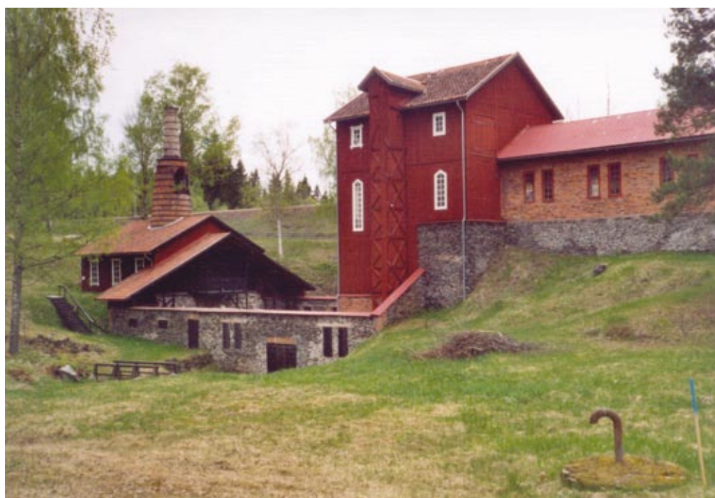
Klenshyttan i södra Dalarna, etablerad vid 1700-talets början.

Kommitténs förslag godtog inte av regeringen med motiveringen att det var för få som var utbildade för uppgiften som förvaltare. Frågan om ett uthålligt skogsbruk kom ändå upp i riksdagen 1903, då Sveriges första nationella skogsvårdslag behandlades. Liberalen Carl Lindhagen motionerade då om att ägare till större skogsinnehav skulle vara skyldiga att sköta sina skogar enligt en plan för uthålligt skogsbruk. Förslaget föll på grund av uteblivet stöd från första kammaren (Fk). Lindhagen återkom med sin motion varje år från 1907 till 1910, men med samma resultat som tidigare, alltså ja från Ak och nej från Fk.