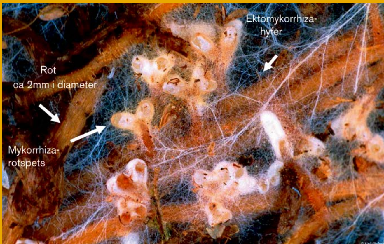
Figur 2. Mykorrhiza – svamprot. Bilden visar finrötter av tall med den typiska fullt synliga gaffelgreningen som uppstår när tallrotspetsarna koloniserar av ektomykorrhizasvamp. De tunna trädarna är svampens mycel som också kan bilda för ögat synliga strukturer, och de mest uppenbara är de åtråvärda matsvamparna t.ex. karljohanssvamp. Näringsämnen som t.ex. kväve fångas upp av mycelet ute i marken samt mykorrhizarotspetsarna, och används antingen direkt av svampen för att bilda hyfer för näringsupptag och sporproducerande fruktkroppar, eller som handelsvara med trädet där kvävet byts mot sockerföreningar som trädet bildat genom fotosyntes. "Växelkursen" bestäms av kvävetillgången.

■ En hjälpsam svamp för träd i näringsfattiga skogar – det är mykorrhizas vedertagna roll. Men hur hjälpsamma är egentligen dessa mykorrhizasvampar? Det beror på näringsstillgången säger den senaste forskningen, som visar på en affärsmässig relation mellan parterna där träden, på både gott och ont, hamnar i ett beroendeförhållande till svamparna.