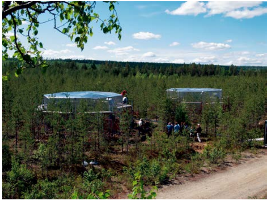
Figur 3. Försöket utfördes i en ungskog av tall. På bilden syns två plasttält, 50 m 2 i bottenyta och 5 meter höga. Tälten sattes upp på ytor som antingen var starkt kvävebegränsade (ogödslade) eller nyligen hade tillförts kväve motsvarande en dos av 100 kg per hektar. När tälten rests tillfördes inmärkt kol i form av kol-13-koldioxid ( ^{13}\text{CO}_2 ), och under den tid (1–3 timmar) som tälten var uppe togs det inmärkt kol upp av träden genom fotosyntes. Dagen efter inmärkningen med ^{13}\text{CO}_2 injicerades en liten mängd (motsvarande 2 kg per hektar) inmärkt kväve i form av kväve-15-ammonium ( ^{15}\text{NH}_4^+ ) i marken på samma ytor som tälten stått på. De två pulserna av inmärkt kol och inmärkt kväve följdes sedan genom att prov togs av barr, stam (floem), rötter, ektomykorrhiza och mark. Provtagningen var intensiv de första dagarna för att sedan avta i intensitet. Det sista provet togs ett år efter inmärkningen.

Vår modell pekar på ett mer funktionellt samarbete mellan svamp och växt när markens kväveutbud är lite högre. Under sådana förhållanden blir mer av det kväve svamparna tar upp från marken tillgängligt för export till trä-