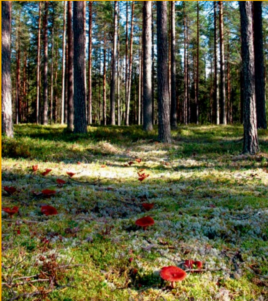
Figur 1. De boreala barrskogarna är i de flesta fall kvävebegränsade och domineras av ett fåtal träd- och fältskiktsarter som är väl anpassade till denna begränsning. Bilden visar en kvävefattig tallskog i Västerbotten, Svartbergets försöksark, Vindeln.