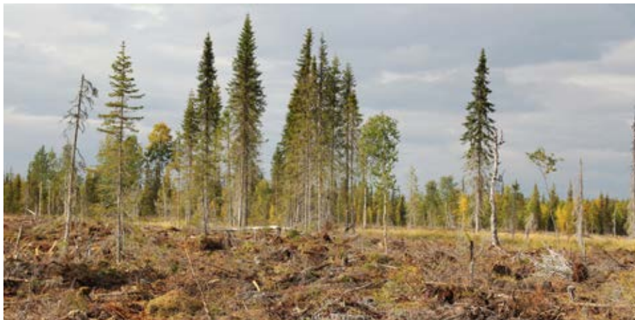
Figur 4. Den totala trädvolymen i hänsynsgruppen är viktigare än hur stor area den täcker, så i ett bestånd som detta är risken för trädmortalitet relativt hög.

”Det var alltså trädens totala volym i gruppen snarare än trädgruppernas yta som påverkade trädmortaliteten.”