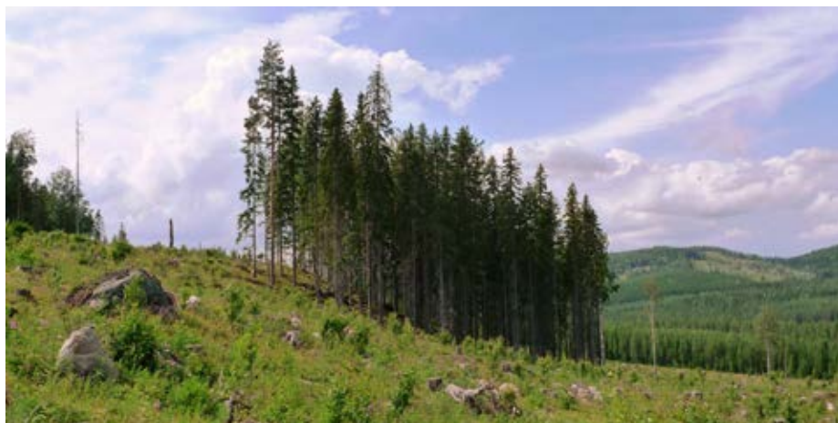
Figur 3. Den stora trädvolymen i denna trädgrupp sänker den förväntade träd mortaliteten. Å andra sidan är gran det känsligaste trädslaget och vindexponeringen relativt stor. Träd tätheten är dessutom stor, vilket för gran ökar mortaliteten.

Av de döda träden låg 71 % som vindfallen på marken, vilket talar för att vind var den dominerande dödsorsaken.