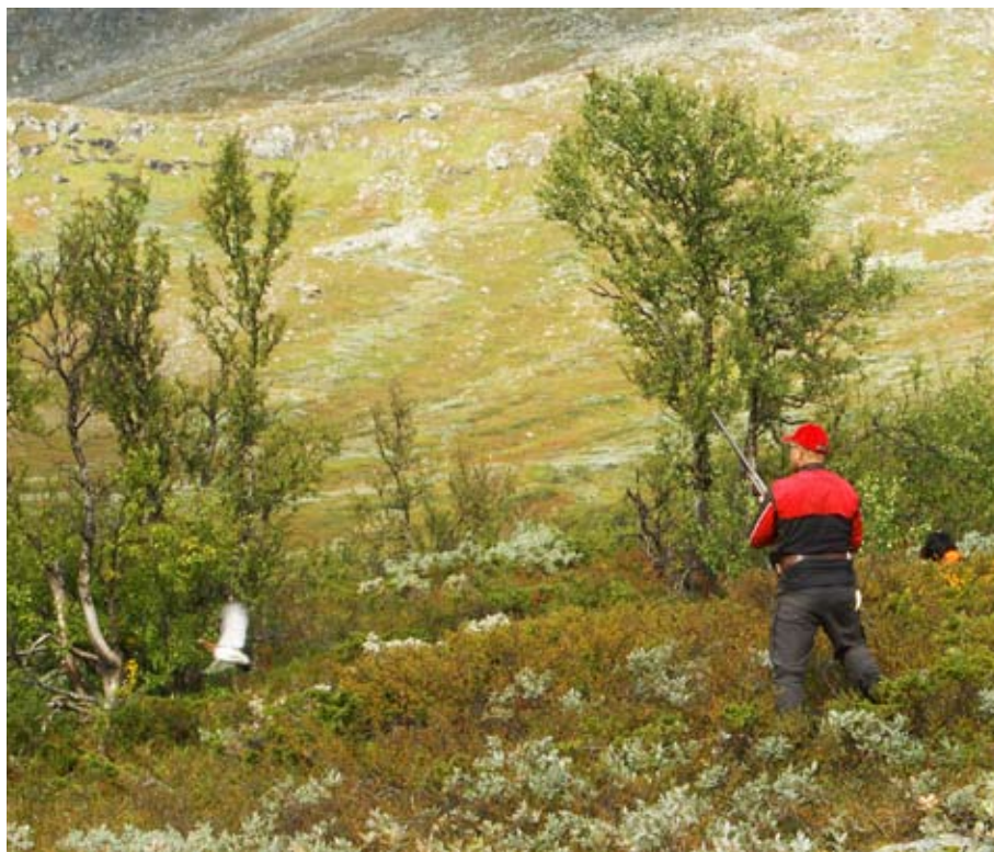
Rekreativvärdet en viktig del av jaktens värde.

Även när det gäller jaktvärdets fördelning på jaktkostnader (till exempel för jaktmarksarrenden, resor och utrustning) och nettojaktvärde (värdet av jakten utöver kostnaderna) har betydande förändringar skett. Förhållandet mellan dessa värdekomponenter jaktåret 2005/06 framgår av Tabell 1. För landets genomsnittsjägare upptogs de cirka 11 200 kronorna i totalt bruttojaktvärde till 64% av jaktkostnad och till 36% av nettojaktvärde. Motsvarande procenttal jaktåret 1986/87 var nästan de omvända – 42% i jaktkostnad och 58% i nettojaktvärde. Det har med andra ord blivit avsevärt dyrare att jaga. Att jaktkostnaden upptar, grovt