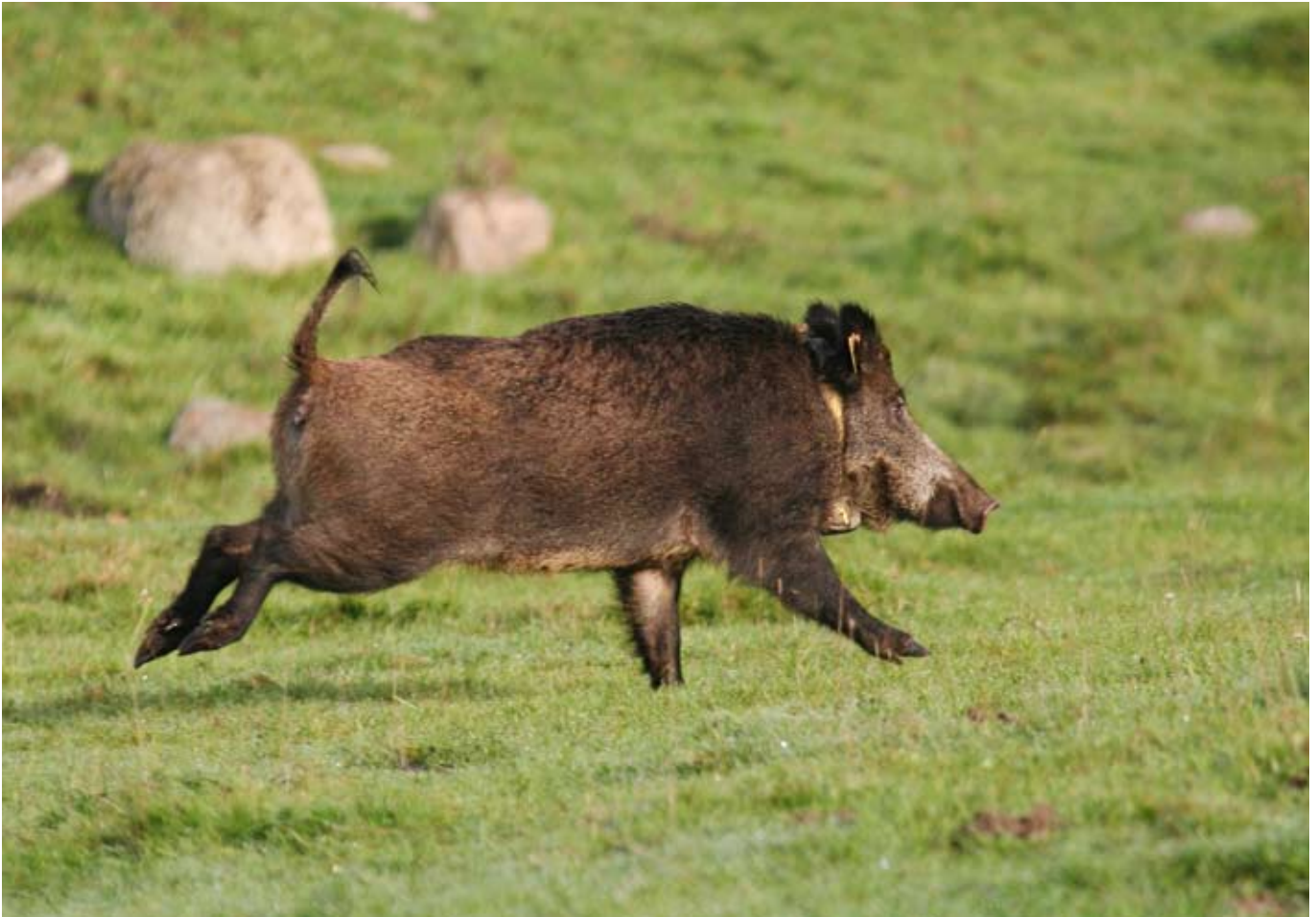
Vildsvinet andel av jaktvärdet ökar i södra Sverige.