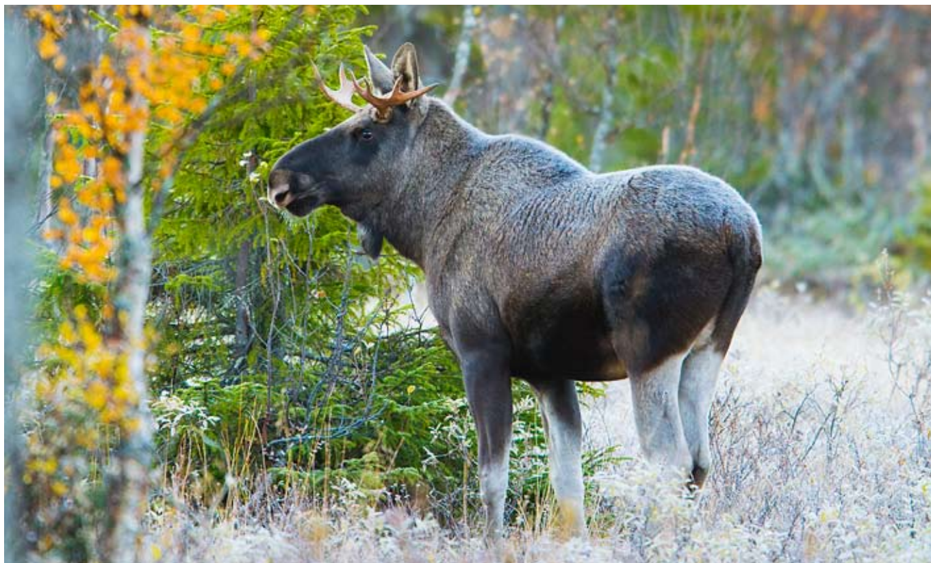
Älgen viktigast för jaktens värdering i Sverige.

gen än vad fallet är i söder, eftersom andelen jägare av befolkningen är nästan tre gånger så stor i Norrland som i Götaland/Svealand (cirka 8 respektive 3% av den vuxna befolkningen).