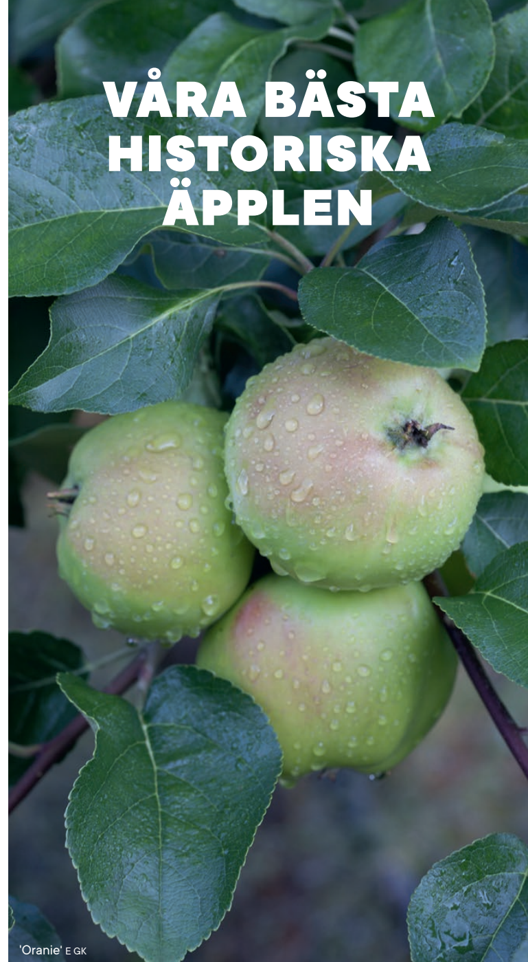
'Oranie' E GK