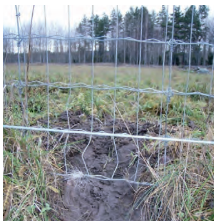
Rovdjur kryper oftast under stängsel. Alla kryphål och svackor behöver därför tätas.