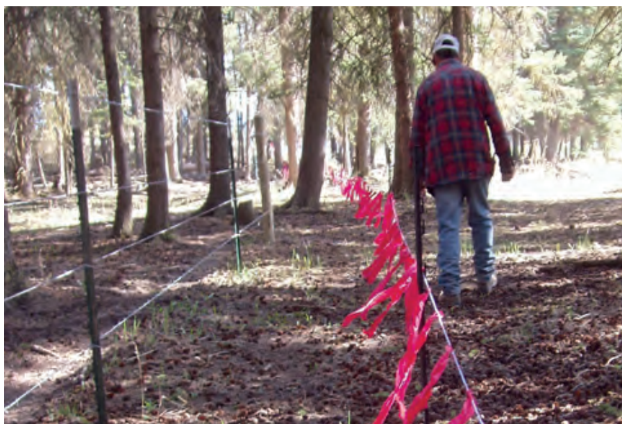
Lapptyget ska sättas upp så att det vajar fritt i vinden.

och mindre vägar som traktorvägar och kan därmed styras in mot grindar eller andra öppningar i hagar. Sådana kan utgöra svaga punkter och bör tätas extra noga. Om det finns stora stenar eller andra föremål på utsidan av stängslet som underlättar för djur att ta sig in, kan stängslet behöva dras in en bit.