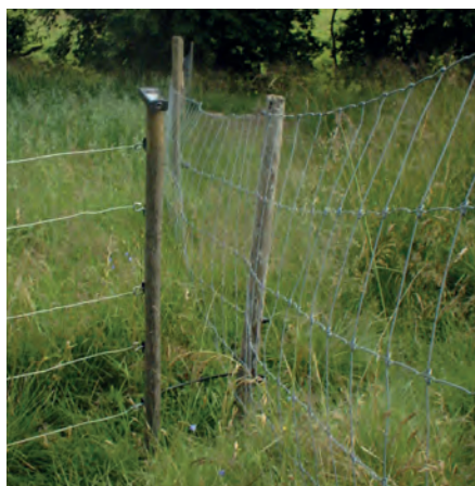
Exempel på en svag punkt som måste tätas.