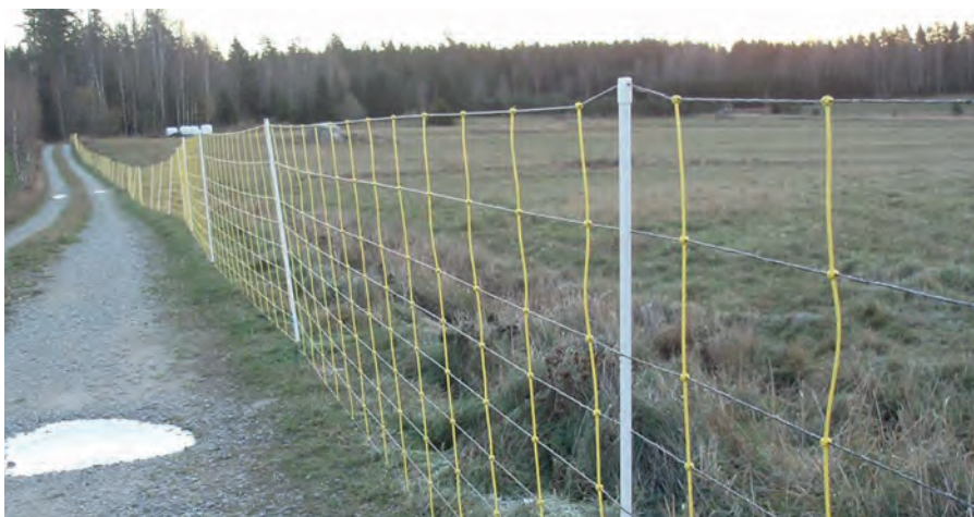
Ett elnät med styva vertikala ledare kan monteras som en akutåtgärd.

Lapptyg går snabbt att sätta upp. Det är viktigt att tyglapparna hänger fritt så att de kan röra sig i vinden, annars tycks vargarna vänja sig snabbare och effekten avta. De bör sitta så att de