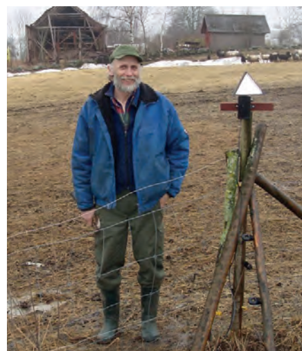
Roterande spegelprismor har använts mot örngrepp i fårbesättningar.

Roterande spegelprismor används främst för att hindra fåglar från att landa i växande grödor, men har även använts för att skydda nyfödda lamm från örngrepp.