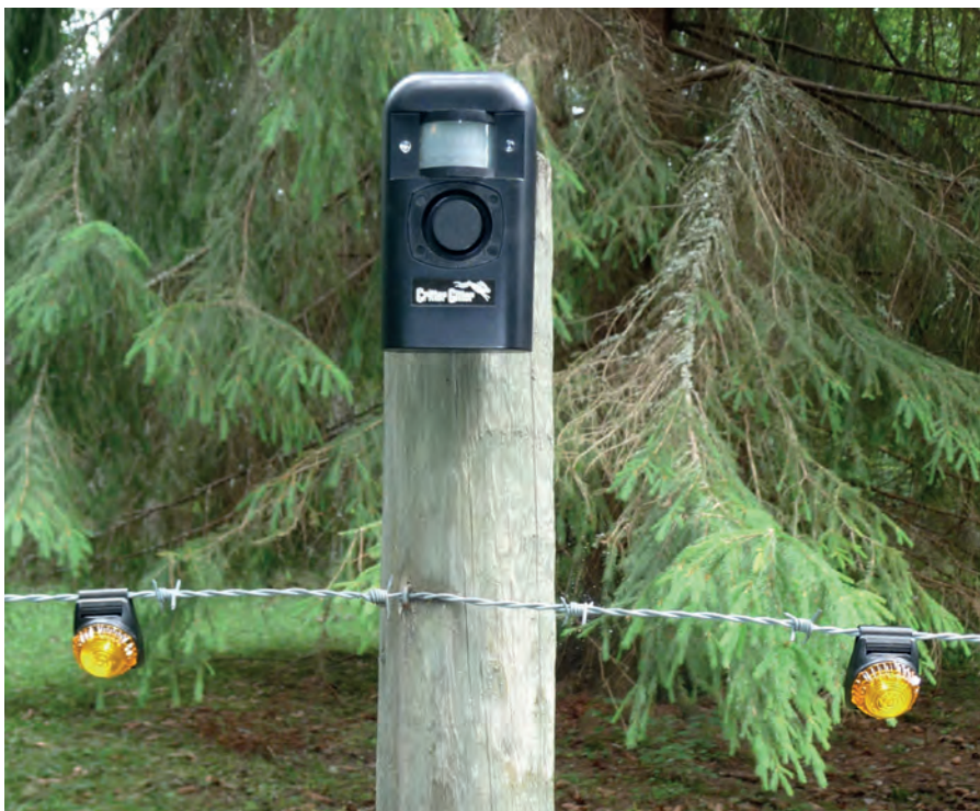
Critter gitter monteras så att djurets rörelser kan aktivera ljudskrämmen. Här har den satts upp tillsammans med ljusstarka lampor på ett befintligt stängsel efter ett angrepp.

Flera ljud- och ljusskrämmor har inbyggda rörelsesensorer så att de startar när ett djur passerar. Ett exempel på en sådan skrämman är Critter-Gitter , som bland annat har använts mot björnar vid bigårdar och ensilagebalar. Den avger ett mycket starkt ljud och aktiveras med en rörelsedetektor. Genom att försöka variera olika slags ljud kan det ta längre tid innan rovdjuren vänjer sig vid störningen.