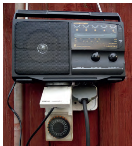
En radio kopplad till en timer.

En radio eller ett blinkande ljus som kopplas till en timer kan man lätt åstadkomma själv. Timern kan exempelvis vara inställd så att störningen i form av ljus eller ljud slås på var 15:e minut. Skrämmen placeras så att den hörs eller syns över så stor del av platsen man vill skydda som möjligt. Åt-