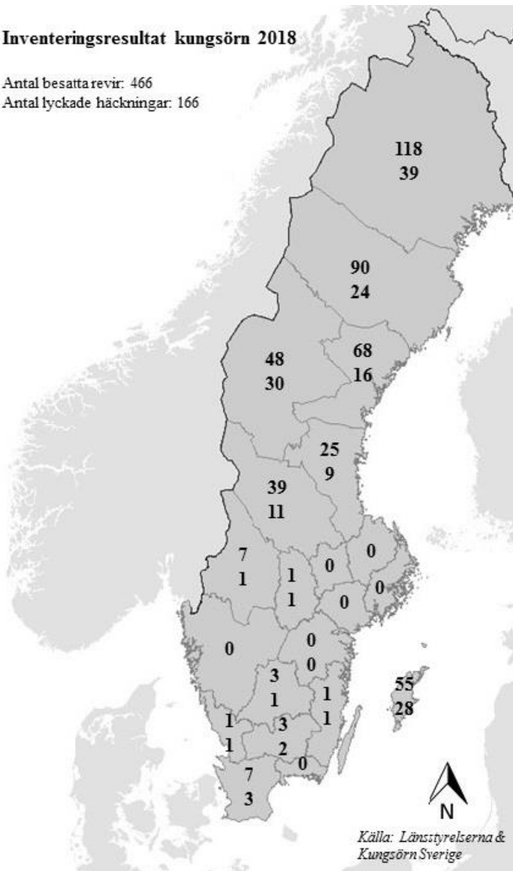
Figur 2. Resultat från inventeringen av kungsörn 2018 enligt länsstyrelsernas sammanställning. Siffrorna anger antal besatta revir respektive antal lyckade häckningar i respektive län.