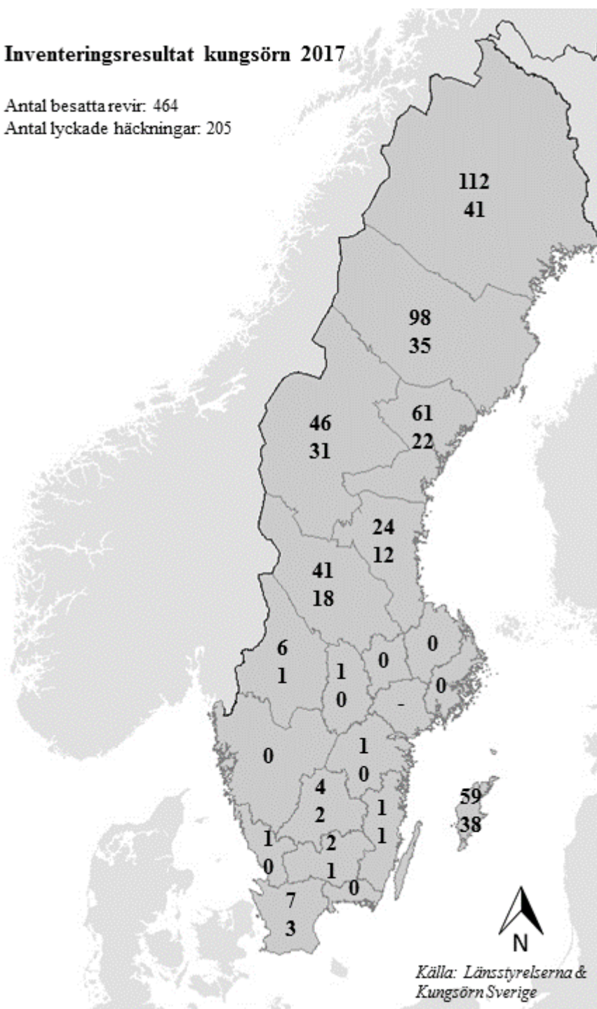
Figur B2. Resultat från inventeringen av kungsörn 2017 enligt länsstyrelsernas sammanställning. Siffrorna anger antal besatta revir respektive antal lyckade häckningar i respektive län. I Södermanlands län genomfördes ingen inventering.