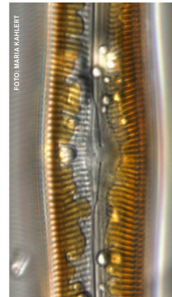
Levande kiselalg (Pinnularia)

Delprogrammet Kiselalger är ett frivilligt samarbete där allt mer av den regionala miljöövervakningen successivt ska samordnas lokalt, regionalt och nationellt. Syftet är att göra gemensamma utvärderingar och mer tillförlitliga bedömningar av miljöstillståndet och därigenom få ut mer av insatta resurser.