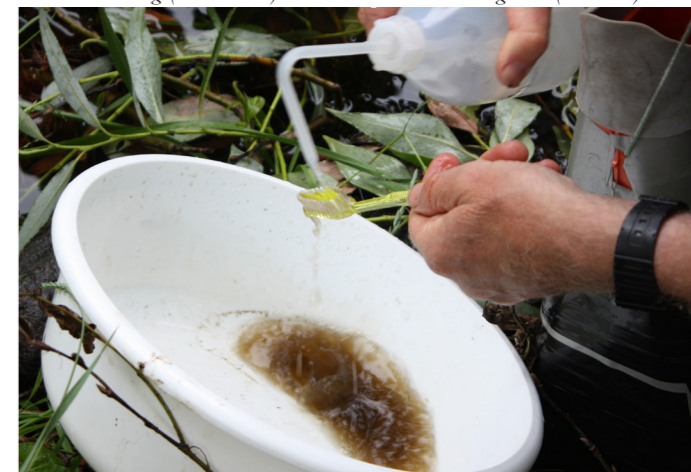
Kiselalgsprovtagning med tandborste