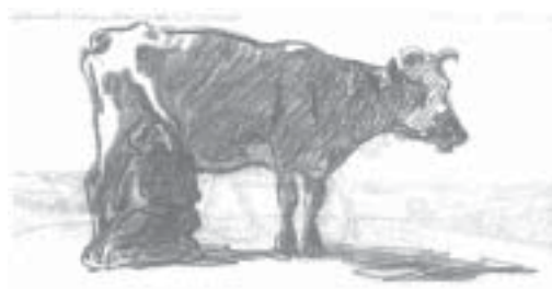
TECKNING: NILS KREUGER