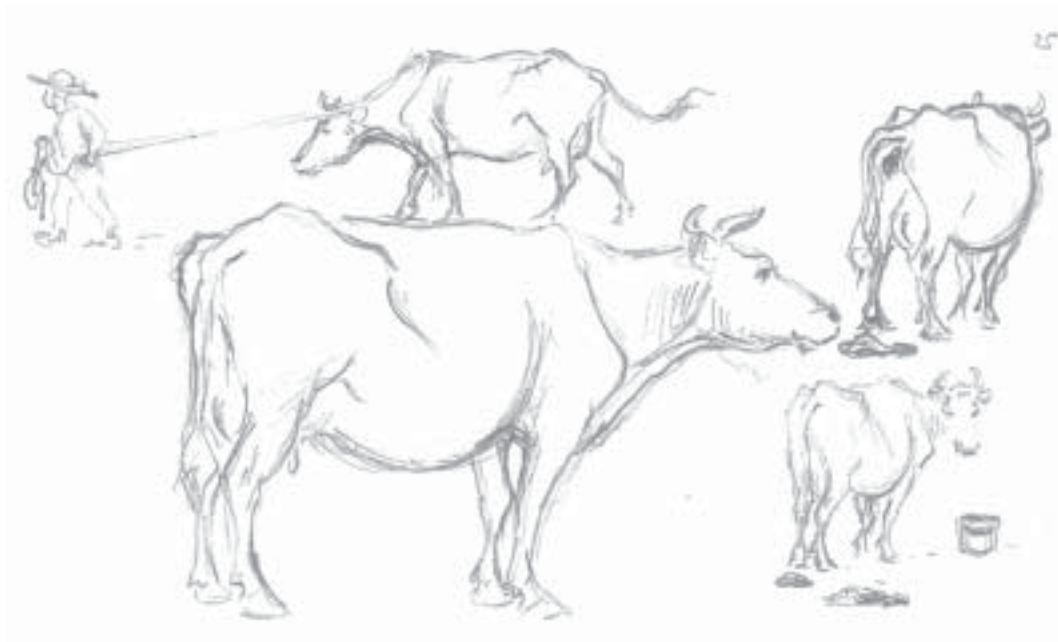
TECKNING: NILS KREUGER