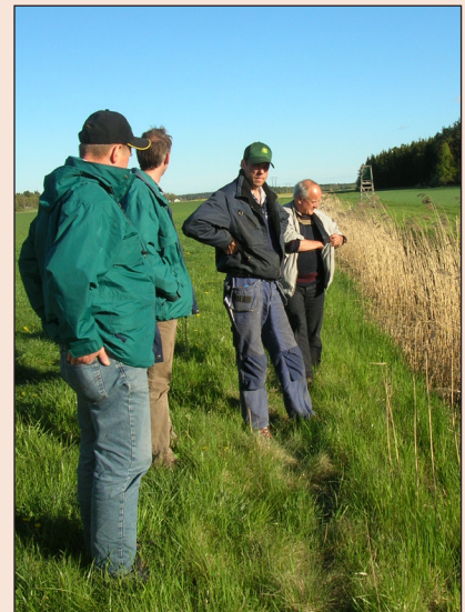
FIGUR 3. Skyddszonen skyddar vattenmiljön och underlättar samtidigt för nödvändiga fälttransporter.

I gårdens naturbetesmark finns bl.a. mandelblom, svartkämpe, brudbröd, tjär-