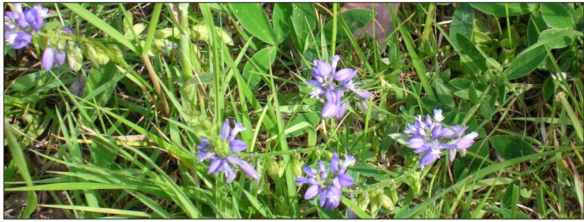
FIGUR 4. Jungfrulin är en bra indikator på långvarig kontinuerlig hävd och en av de första arterna som försvinner om hävden upphör.

En viktig del av arbetet var besöken på varandras gårdar, då man diskuterade resultaten av inventeringarna, utböt erfarenheter och fick idéer till arbetet på den egna gården. Gruppen ansåg det även värdefullt att bjuda in resurspersoner från