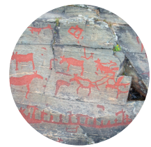
Hällristningar med älg vid Nämforsen.

Rovdjur är djur som jagar, dödar och äter andra djur. Det finns stora och små rovdjur men även pyttepyttesmå rovdjur som olika typer av insekter och spindlar. Stora rovdjur är exempelvis brunbjörn, varg, lodjur, järv och kungsörn. Små rovdjur kan vara rävar, vesslor, hermeliner eller ugglor. Rovdjur finns i hela Sverige men alla rovdjur finns inte överallt.