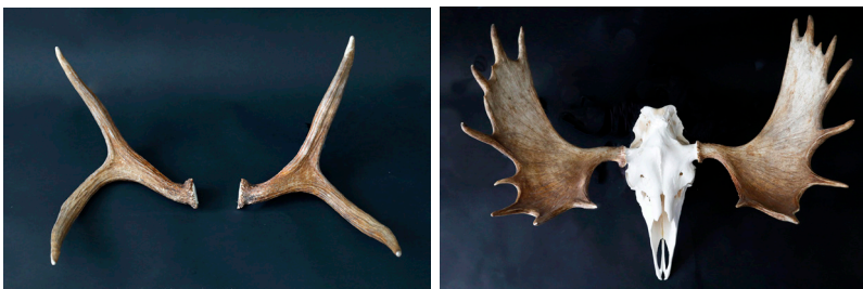
Stånhorn och skovelhorn.

När älgturen nått sin topp, vilket kan ske vid 7–9 års ålder så säger man att den börjar gå på retur. Får den bli äldre så sjunker antalet taggar men grovleken fortsätter öka, liksom spännvidden. Det är dock ovanligt att tjurar blir äldre än så. De flesta tjurar dör betydligt tidigare.