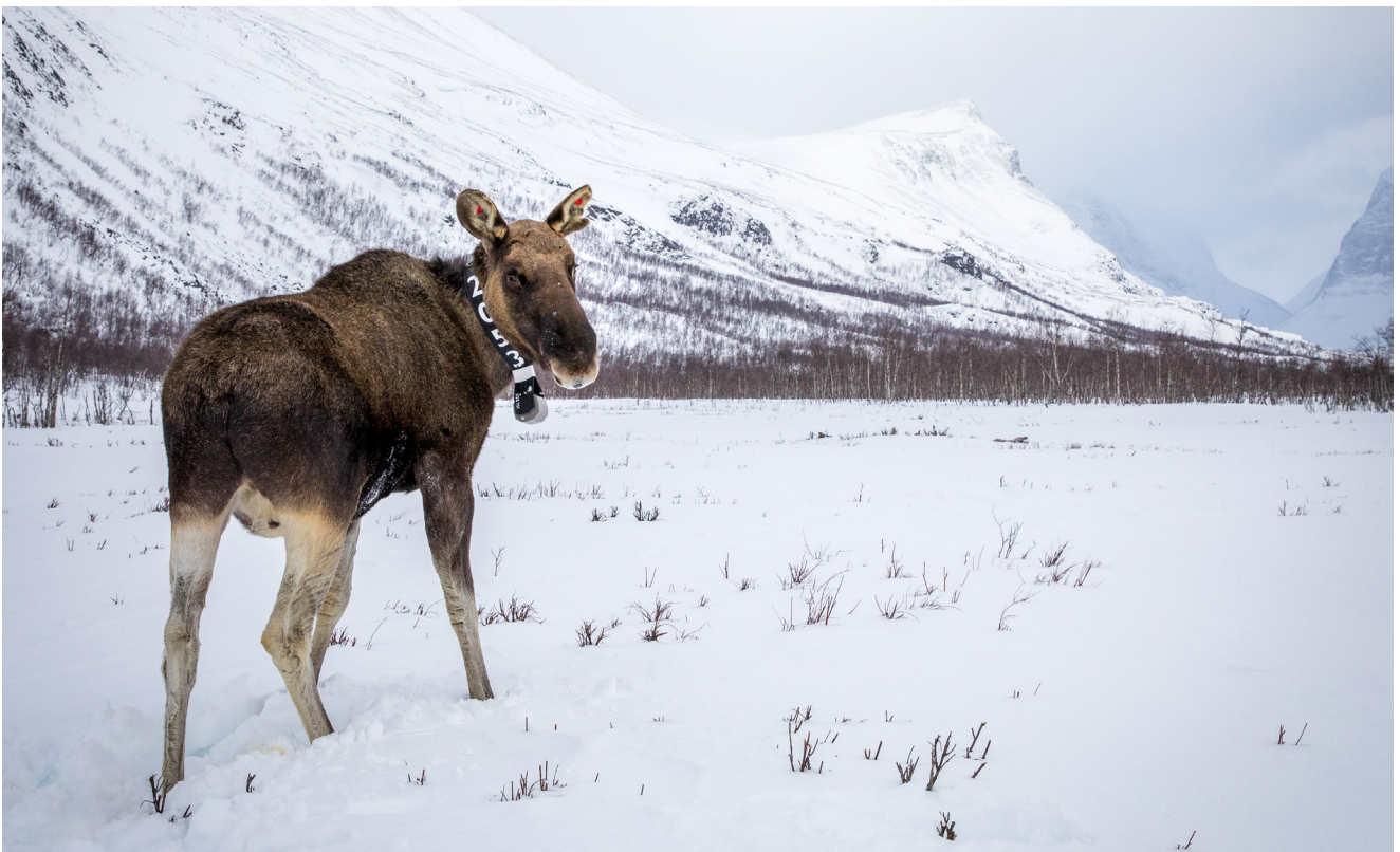
Älg i Nikkaluokta med GPS-halsband.

Älgarna har halsband med sändare för att vi ska lära oss mer om älgen. Hur, var och varför den rör sig, hur klimatförändringarna, vädret, jakt och rovdjur påverkar den, med mera. Det är utbildad personal på Sveriges lantbruksuniversitet, SLU, som sätter på halsbanden efter att älgen sövts med en bedövningspil från en helikopter. Det är förbjudet att sätta halsband på älgar utan att ha en massa olika tillstånd och kunnig personal, vilket SLU har.