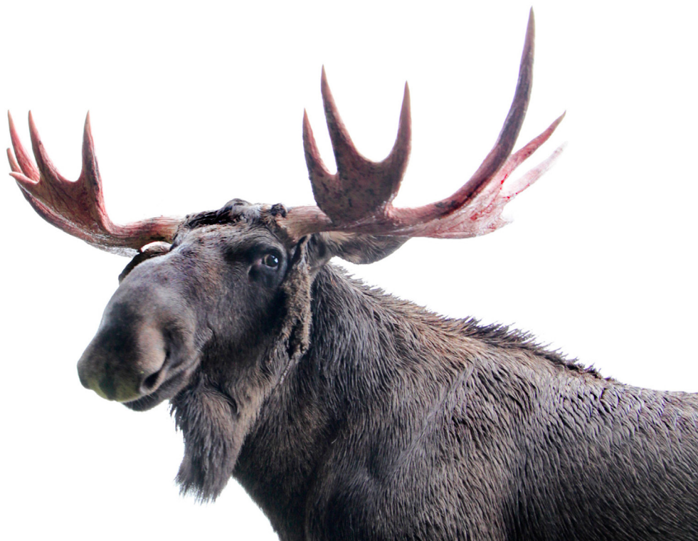
Älg tjur.

En älghane kallas tjur eller oxe och en älghona kallas ko (kviga innan hon fått kalvar). Älgens ungar kallas kalvar. För att en älgkalv ska bli till behövs en älgko och en älg tjur som parar sig. Efter parningen lever älgkon och älg tjuren på varsitt håll och det är älgkon (mamman) som uppfostrar kalven det första året.