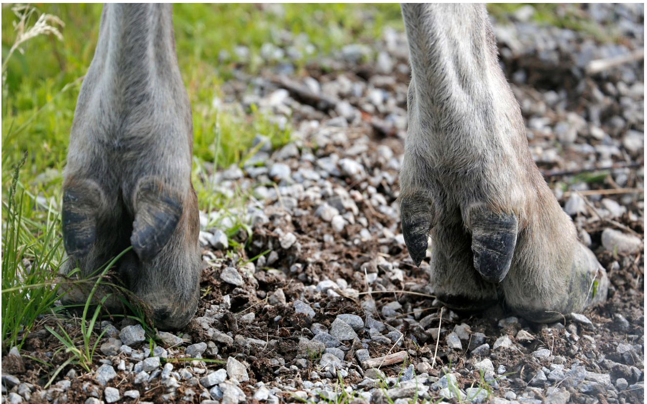
Så här ser lättklövarna ut.