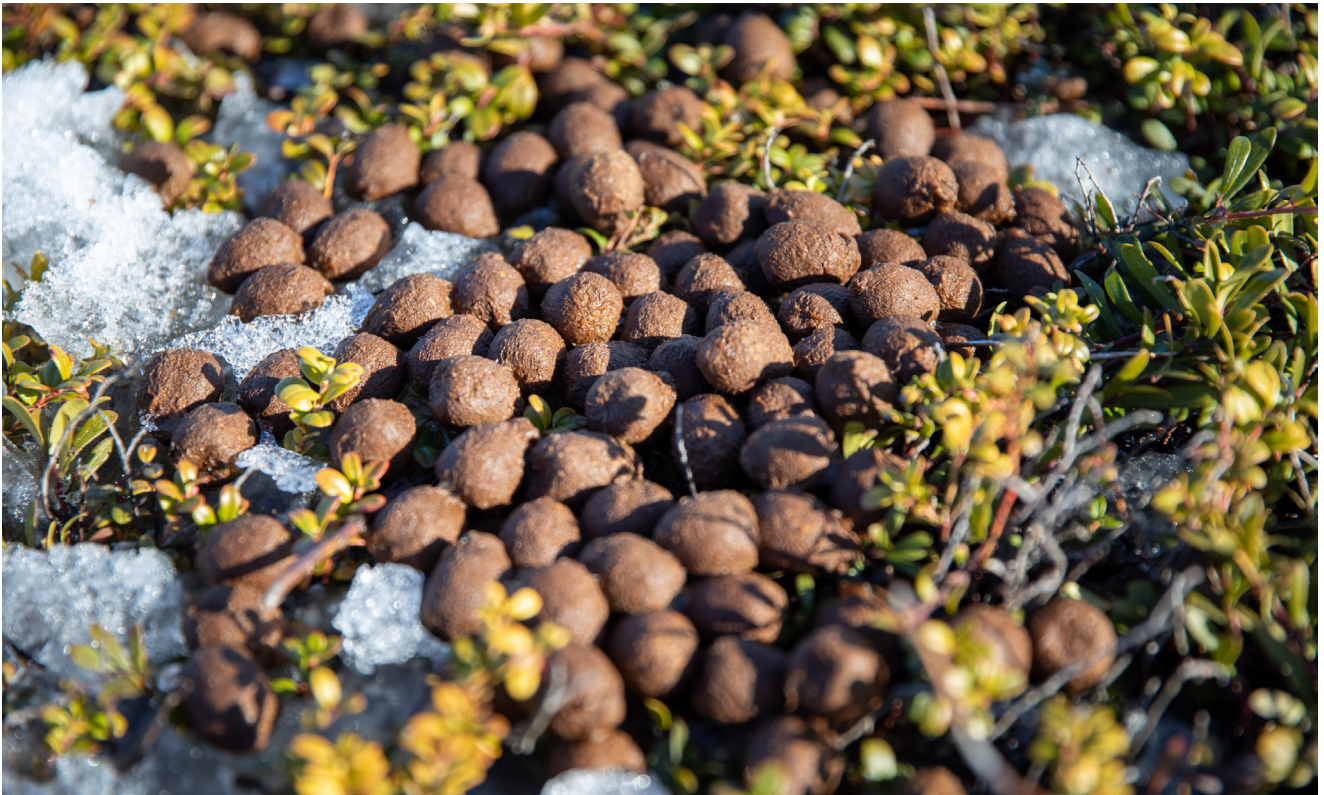
Älgspillning i mars.

På hösten, vintern, och tidig vår när födan är mer fiberrik så är bajset mer "klassiskt" med ovala mörkbruna kulor som är några centimeter långa. Vuxna djur har större kulor än kalvar. Högarna har oftast 10–30 kulor och älgen bajsar ganska ofta – upp till 20 gånger per dygn.