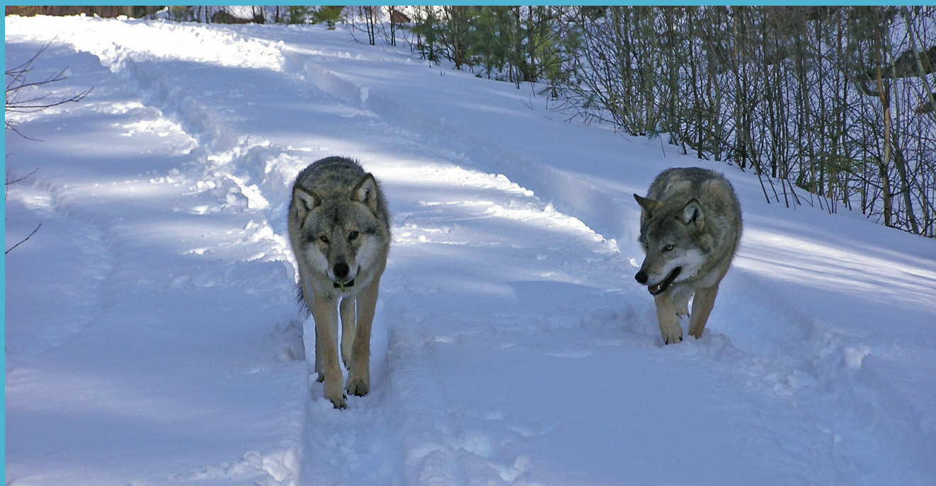
Alfapar vid Amungen.

■ Hur stora hemområden olika arter utnyttjar för sina behov kan variera från några få kvadratmeter för små arter, till många tusen kvadratkilometer för större djur. Även inom arter förekommer en betydande variation i hur stora områden olika individer använder. Denna variation i områdesutnyttjande är kopplad både till ekologiska faktorer såsom livsmiljöns beskaffenhet och till sociala faktorer. Exempel på faktorer i miljön kan vara bördighet och typ av växtlighet. Exempel på sociala faktorer kan