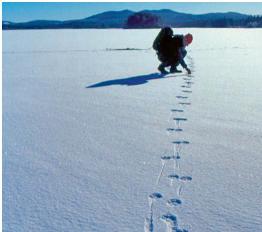
Vargspårning i Leksandsreviret vid Säxen, februari 2002.

ca hälften av älgindividerna är det. Vargarna väljer framförallt unga och gamla älgar. Jaktframgången styrs troligen också av miljön, där vissa områden är mer fördelaktiga för vargen att lyckas med sina attacker medan andra områden är mer fördelaktiga för bytesdjuret för att undkomma dessa attacker. Skillnader i tillgänglighet av bytesdjur, både beroende på art och miljörelaterad jaktframgång, kan då eventuellt förklara en del av de globala skillnaderna i vargens revirstorlek.