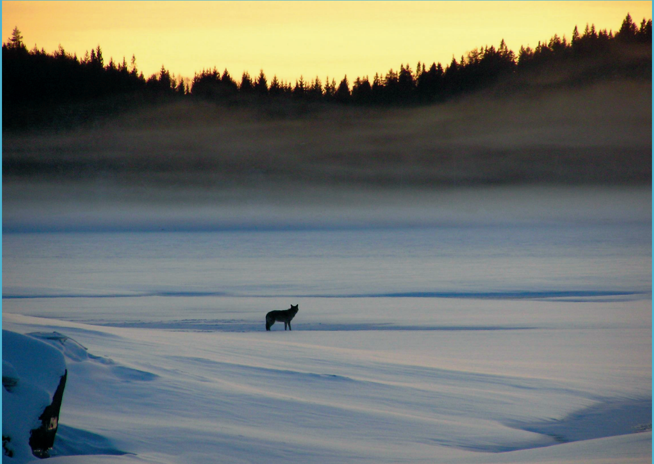
Ulriksbergstiken.