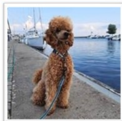
Andra pris! Mango i hamnen i Hjo efter avklarad doftprov.