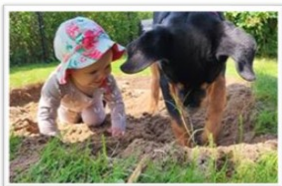
Första pris! Mini-matte och Extra river den gamla sandlådan för att göra plats åt den nya.