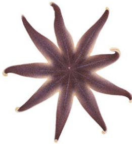
Gul solsjöstjärna (violett individ)