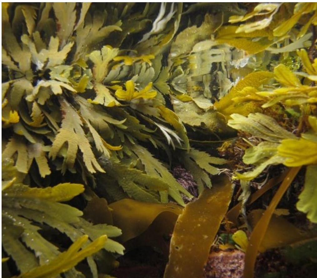
Tångsamhälle som speglas i ytan: FOTO: Josefin Sagerman