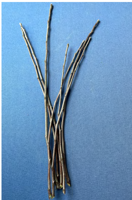
De stora äppelträden förökades med ympkvistar, när de flyttades från Balsgård till Alnarp.